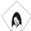
Emma Graf Preis