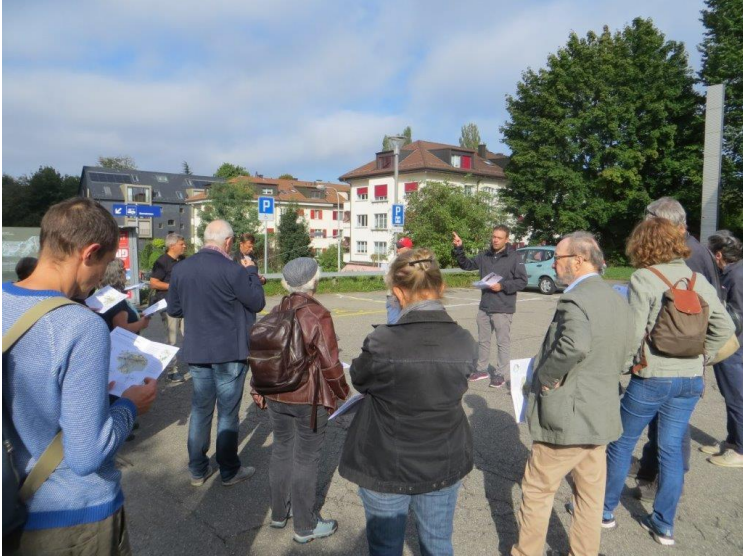
Delegiertentag in Ostermundigen.